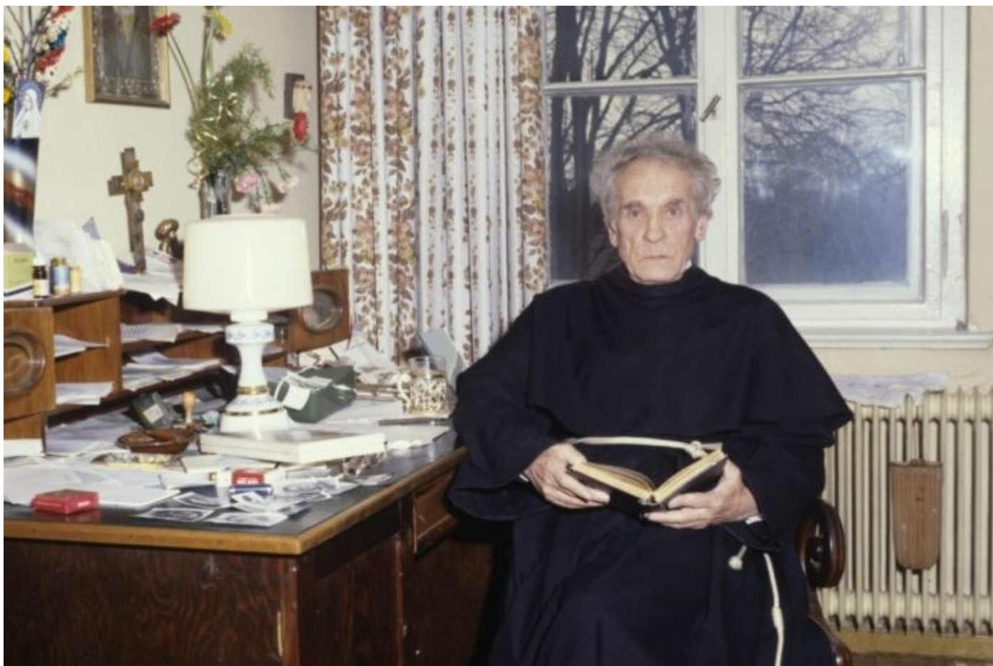
Ojciec Czesław Klimuszko.

Najsłynniejszy polski franciszkanin, ojciec Andrzej Klimuszko dał się poznać z niezwyklej zdolności. Duchowny posiadał dar przewidywania przyszłości, miał wizji, z których część już się spełniła. Przewidział m.in. wybór Karola Wojtyły na papieża, czy inwazję żołnierzy, którzy na „małych, okrągłych łódkach” dopłyną do Europy (przepowiednia mocno kojarzy się z islamskimi przeprawami przez Morze Śródziemne do Europy). Zakonnik przekazał też informacje o przyszłości Polski.