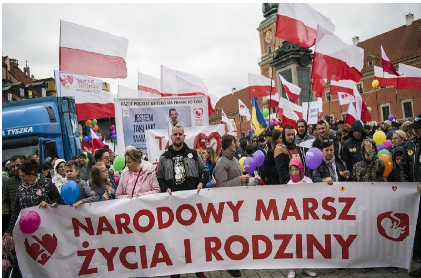
Warszawa 19.09.2021. XVI Marsz Życia i Rodziny w Warszawie.

Żadne wahadło się nie odchyli. Czas zlikwidować kolejną „przesłankę aborcyjną”!