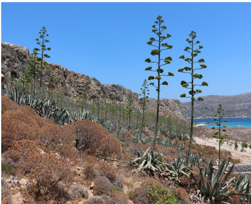
"Agave americana in Gramvousa (Crete)"