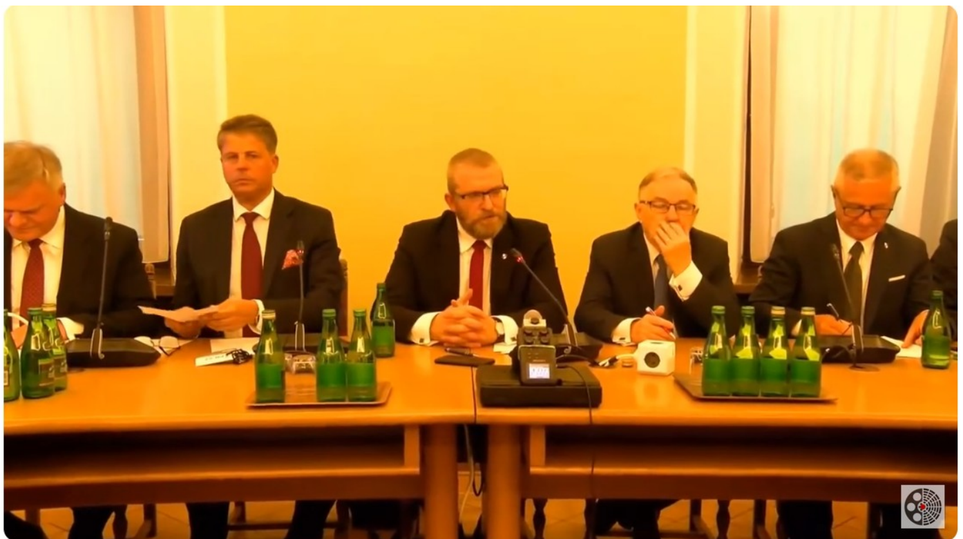
Grzegorz Braun: Stop aborcji i eutanazji