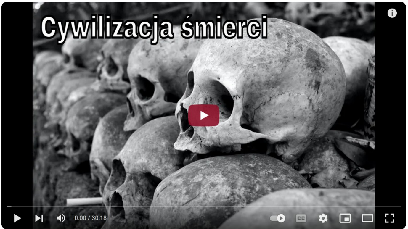
Cywilizacja śmierci muzyka z dreszczykiem /The civilization of the death of a musician with a thrill